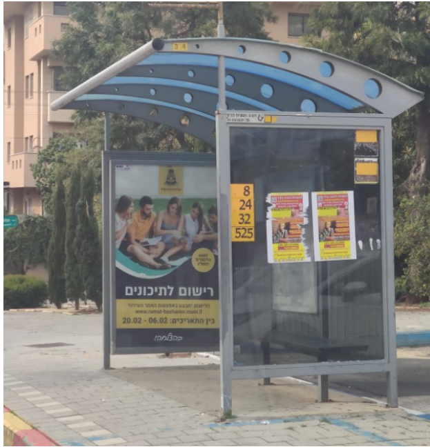
5.2 סככת המתנה חדשה תהא בעלת מראה ומסוג שווה ערך לדגם המוצג באמצעות תמונות ושרטוט כמופיע להלן.

5.3 נראות דגם סככת ההמתנה עם ארגז פרסום שיספק הזוכה יהיה תואם ו/או שווה ערך לדגם המוצג שלהלן :